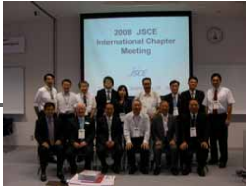
平成20年度 海外支部会議にて(東北大学)